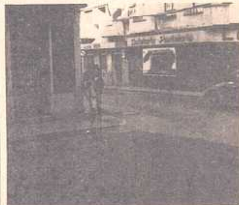
Para quando um resguardo que evitasse mais acidentes nesta «curva da morte?»