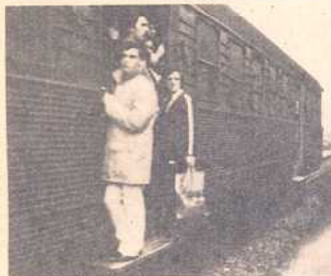
Viajar pendurado: a alternativa e o risco