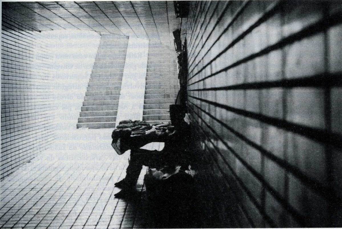
Brasília, 1999.

colorido das ficções da comunicação de massa. O destaque é dado à força da colonização do imaginário do homem comum, através do consumismo dirigido, dirige-se à caracterização de que a nova desigualdade gera dois mundos, uma sociedade dupla, de duas partes que se excluem reciprocamente, mas parecidas por conterem algumas mesmas mercadorias e as mesmas idéias individualistas e competitivas. Só que as oportunidades não são iguais, o valor dos bens é diferente, a ascensão social é bloqueada. Apesar disso, um bloco de idéias falso, enganador e mercantilizado acena para o homem moderno colonizado que passa a imitar, mimetizar os ricos e a pensar que nisso reside a igualdade 10 .