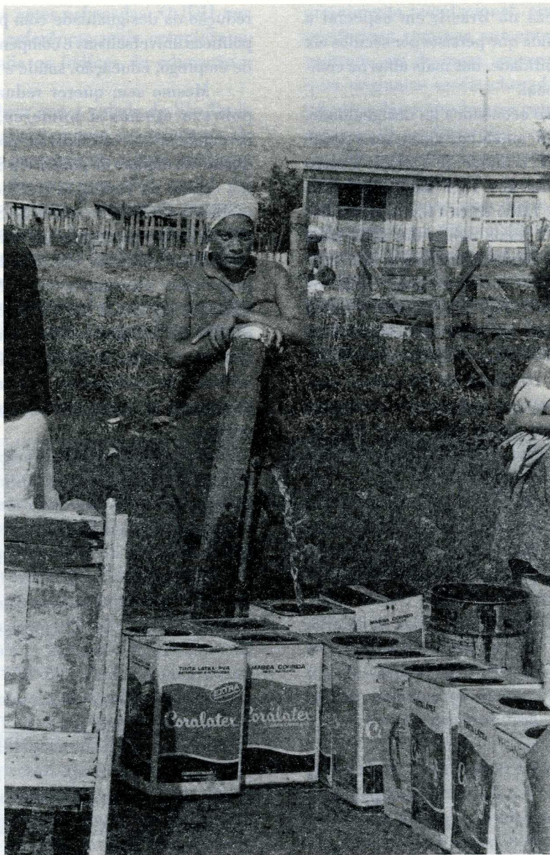
Vila Paranoá, Periferia de Brasília, 1995.

Portanto, como a renda média brasileira é superior à linha da pobreza, pode-se associar a intensidade da pobreza à concentração de renda; e se o padrão de consumo médio é satisfatório, pode-se concluir que não há falta de recursos e sim má distribuição de recursos.